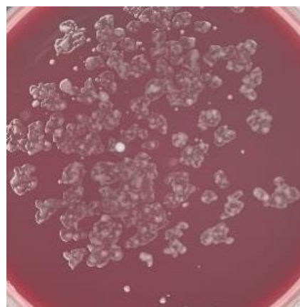
Clostridium difficile ATCC 9689