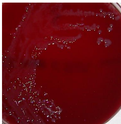
Bacteroides fragilis ATCC 25285